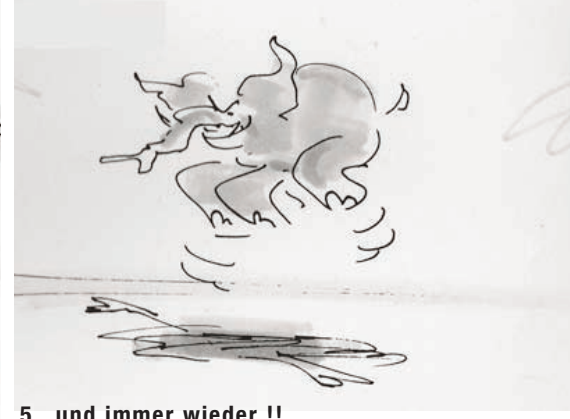
5...und immer wieder !!

Nach den USA und Spanien sind deutsche Jäger EU Spitzenreiter bei der Jagd auf gefährdete und geschützte Arten.