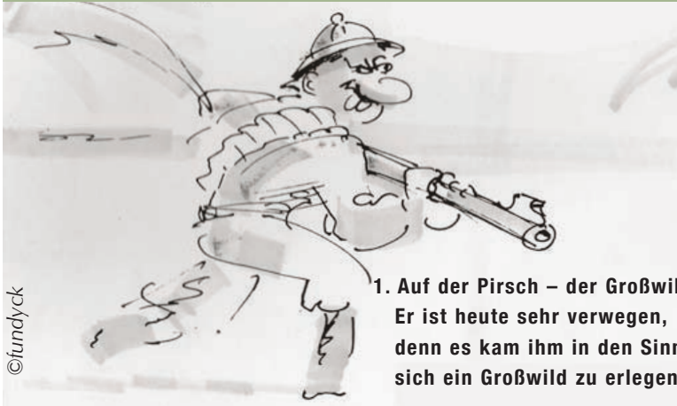
1. Auf der Pirsch – der Großwildjäger! Er ist heute sehr verwegen, denn es kam ihm in den Sinn, sich ein Großwild zu erlegen...