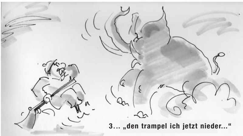
3... „den trampel ich jetzt nieder...“