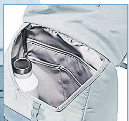
Sydney UVP 119,95 €

Der UP Sydney bietet ausreichend Platz für alles, was du für einen Tag im Büro, in der Uni oder Freizeit brauchst. Dank der ordentlichen Aufteilung und der Deckelöffnung mit Magnetverschluss, erreichst du alle wichtigen Sachen im Handumdrehen. Mit dem Aluhaken an der Deckelöffnung kannst du den Inhalt sicher verschließen.